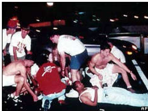
Sl. 2 – Žrtve bombaškog napada u Atlanti 1996. godine

Kada je 20 kilograma teška bomba eksplodirala u Olimpijskom parku 1996. godine u Atlanti, poginule su dve osobe, a 111 ih je bilo ranjeno (Sl. 2). Ove dve lekcije su veoma poučne, posebno za zemlje organizatore olimpijskih igara. Potcenjivanje ovakvih događaja u narednom periodu moglo bi dodatno pogoršati i iskomplikovati bezbednost na olimpijskim igrama.