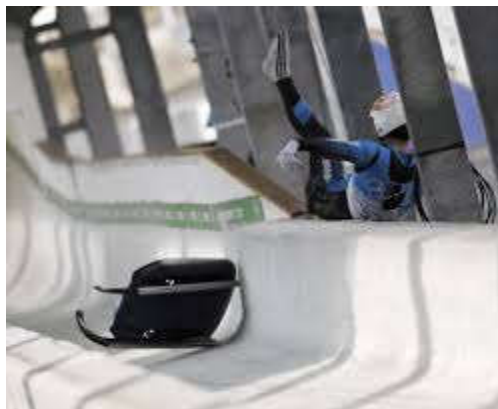
Sl. 4 - Nodar Kumaritašvili neposredno nakon kobnog pada

Ruska skijašica Marija Komisarova je na poslednjim održanim Zimskim olimpijskim igrama održanim u Sočiju 2014. godine zadobila povredu kičme nakon koje neće moći više da hoda. Na Igrama u Sočiju je bio veliki broj povreda, međutim, zvanični izveštaj MOK je da je bio isti kao i na prethodnim Igrama u Kalgariju ( http://www.olympic.org/news/ioc-injury-illness-surveillance-study-protecting-the-athletes-health/225531 ). Navodi se da je posebna Medicinska komisija MOK tokom Igara pratila sve takmičare i beležila svaku povredu. Njihovim daljim istraživanjama, kao i istraživanjima naučnika u oblasti medicine trebalo bi da se nađu rešenja za što bezbednije uslove za takmičare. Postavlja se pitanje da li lekari mogu da utiču na manje atraktivnu, ali bezbednu stazu, koja kao takva ne odgovara organizatorima jer ne privlači dovoljno pažnje.